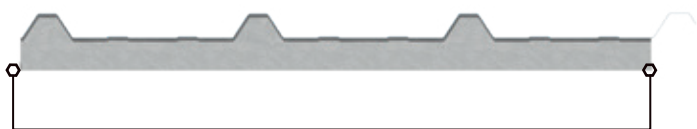
Diseño con ancho útil 1,00 metro

Panel con núcleo de poliestireno expandido (EPS) de alta densidad con recubrimiento en ambas caras de acero galvanizado prepintado. Fabricado en línea continua, es ideal para el uso de cubiertas en general, tanto industriales como residenciales.