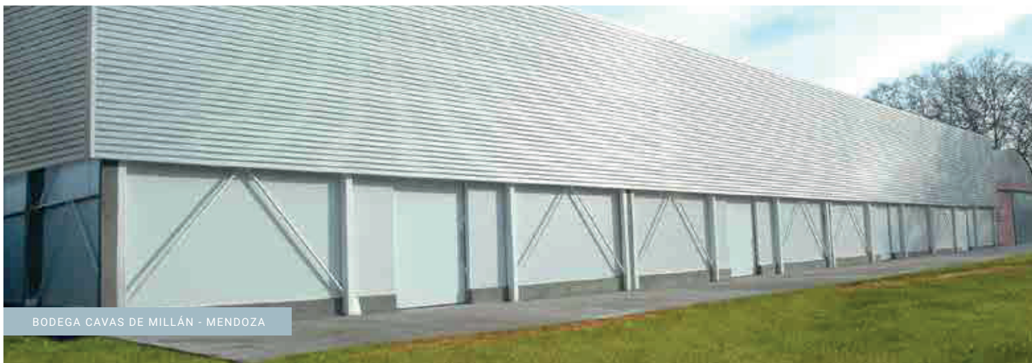
BODEGA CAVAS DE MILLÁN - MENDOZA

Elevada resistencia mecánica con posibilidad de mayor separación entre apoyos.